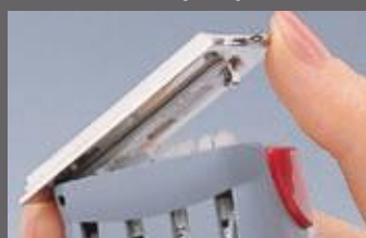
Dateur avec plaque-texte personnalisée

Manipulation simple pour le réglage de la date